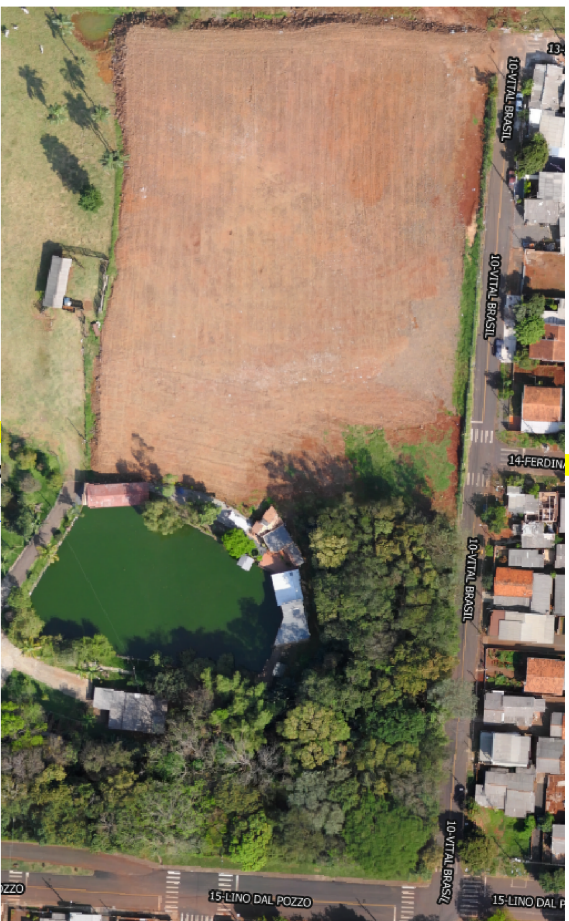
Foto Aérea do local